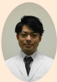
なかつかさりょう