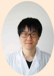
やまのいりょうた