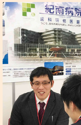
研修医募集の説明会（大阪）にて

中学校と高校は和歌山市内の開智高校に通い、大学は大阪歯科大学に入学し無事111回歯科医師国家試験に合格し、昨年研修医として、紀南病院口腔外科でお世話になることになりました。そして今年度も2年目としてお世話になっております。まだまだ至らぬ部分が多いですが、よろしく申し上げます。