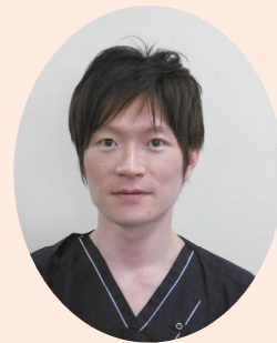
血液浄化センター 南方 大和

高齢化の影響も受け8人に1人は慢性腎臓病という現状であり腎疾患患者が増加の一途を辿っている中、現在当科の医師数は3名で少数ではありますが、それぞれが多面性を発揮し紀南地域の腎疾患診療に貢献できるように努めて行きたいと思っております。これからも皆さまのご協力とご理解を頂きますよう何卒よろしくお願い申し上げます。