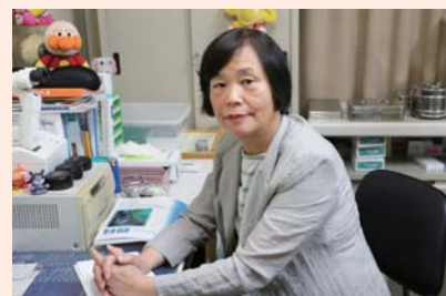
山西内科胃腸科眼科医院 山西 陽子

テニスと勉強でした。大学の講義で毎日習うことが非常に新鮮で模型の頭蓋骨を眺めては少しの間から神経が通っていることの不思議さや、人体組織を顕微鏡で見てその綺麗さに魅了されていました。